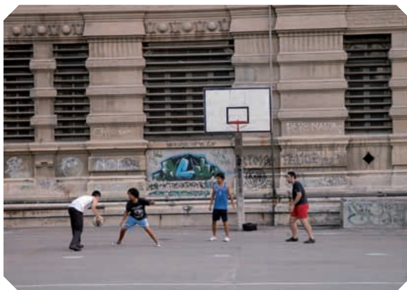
F8 Los edificios del IAVA y de la Facultad de Ingeniería se construyeron en este período.

J. Batlle Y Ordoñez Fundamentación del proyecto de ley de 1912 .